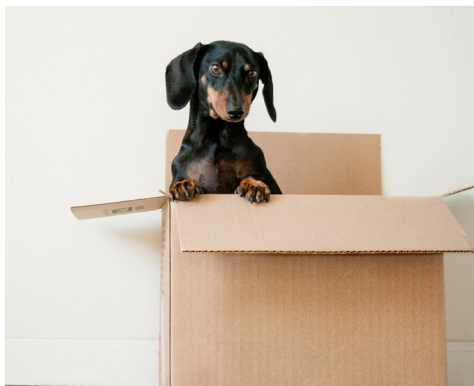
Cartons de déménagement

Étés agréables de 20°C à 25°C en juillet