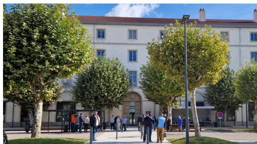
Lycée Fertet de Cray

Études Bac+2 à Bac+3 à Vesoul (IUT), ... et à 2 pas , dans un rayon de 50 km : Besançon et Dijon (villes universitaires). Pour info : au départ de Cray, en bus, le trajet ne coûte qu'1,50 € !