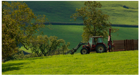
Paysage du Charolais