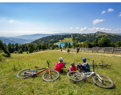
Métabief, Montagnes du Jura/Syndicat Mixte du Mont d'Or