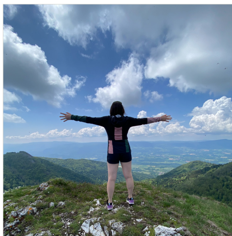
Randonnée sur les Crêtes du Grand Colombier