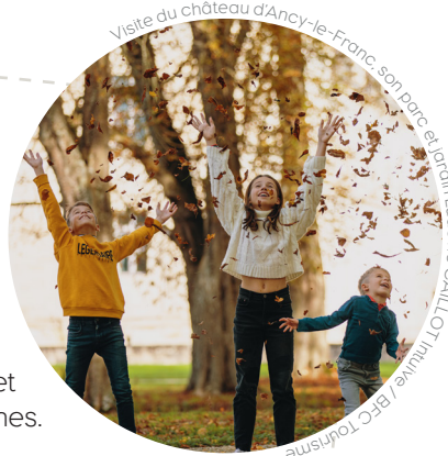
Visite du château d'Ancy-le-Franc, son parc et jardin Ludovic CAILLOT Invalide / BFC Tourisme